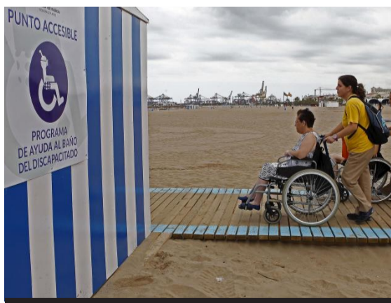
La provincia de Alicante es accesible a todos. J.C.

Con más de una treintena de playas y calas adaptadas para personas con discapacidad o movilidad reducida, el litoral de la provincia de Alicante se ha convertido en uno de los más accesibles de la península. Pasarelas de madera que recorren la arena hasta el mar, rampas, aparatos reservados, servicios y vestuarios adaptados, sistemas auditivos o zonas especiales de sombra son sólo algunas de las medidas que se han puesto en marcha para permitir a los usuarios disfrutar de las cálidas aguas de la Costa Blanca de manera fácil y segura.